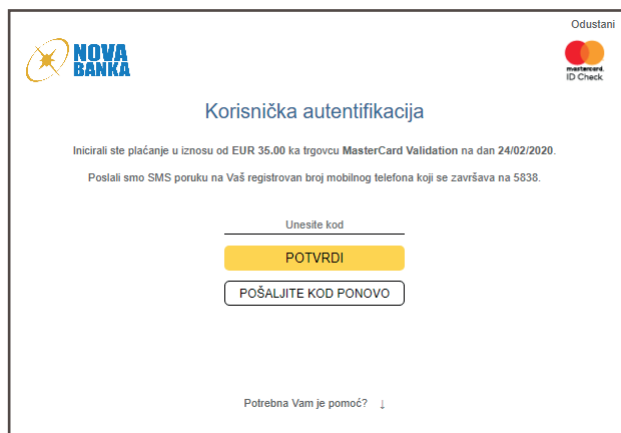
Slika 1. – Prikaz stranice za autentifikaciju

SMS poruka koju dobijate na mobilni telefon je sljedećeg sadržaja: "Inicirali ste transakciju karticom *****1234. Iznos: 123,45 KM. Datum: 20.02.2020, vrijeme: 12:45:32. Vaša lozinka glasi 123456 i važi 3 minute".